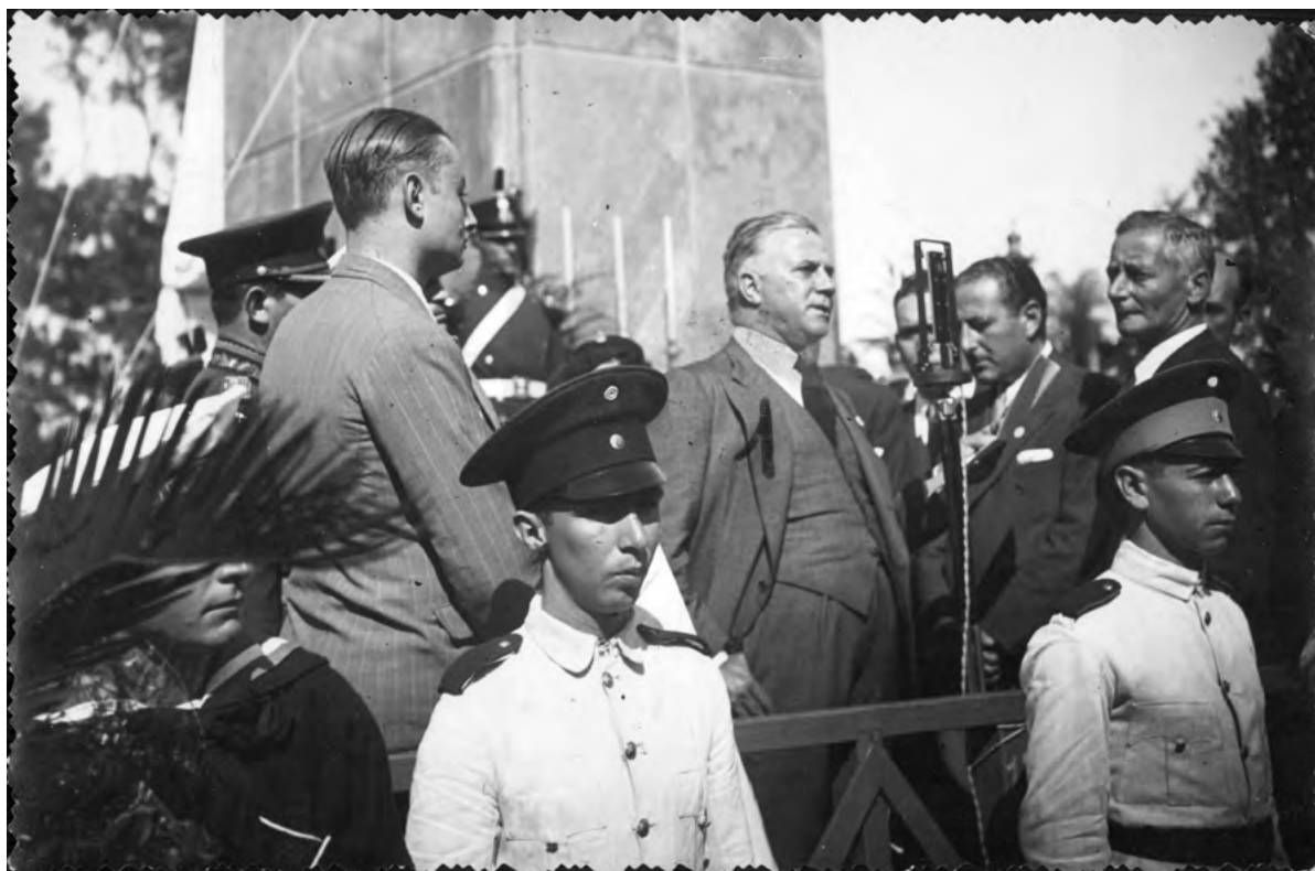
Imagen 5. Inauguración y discurso de gobernador Carlos Acuña con la presencia del presidente de Parques Nacionales Exequiel Bustillo (25/04/1935).

Nacional –correspondiente a una etapa anterior a la provincialización– fue el antecedente y sus planteos arquitectónicos precederán a los que formularán luego otras figuras que abonarán al Movimiento Moderno en Argentina.