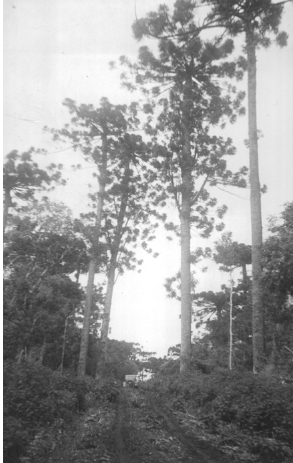
Imagen 1. Camino a Iguazú, 1938.

la espesura ya había pasado. Estos fueron otros tiempos, en los que si bien era difícil prevenirse de encuentros no deseados con los peligros de la selva, también lo era respecto de encuentros con personas que vivían refugiadas en la espesura, probablemente perseguidas por las autoridades. La selva era un espacio sin control, por ello se pensó en una manera de consolidar el territorio y establecer puestos de control de personas y haciendas, hecho que bien pudo construir la dupla Bustillo-Acuña.