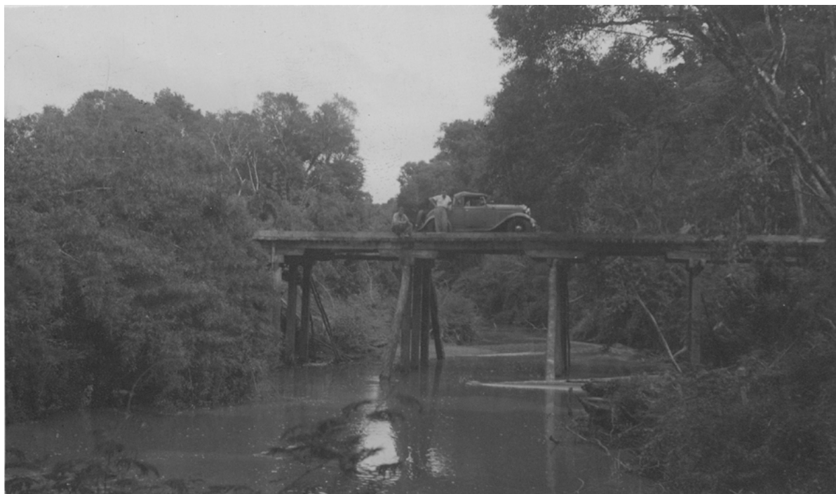
Imagen 2. Puente sobre arroyo Yacuy, 1938.

Veamos un poco más de aquel estado cuasi prístino en el que se encontraba el entorno en el que acontecieron los hechos.