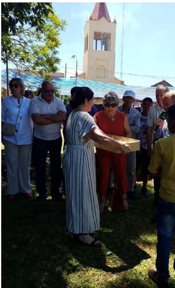
Figura 6. Foto: restitución de talla jesuítica durante el acto central de los festejos por los 400 años de Concepción de la Sierra. https://www.facebook.com/concepcionfesteja

Finalmente, en horas de la tarde, se celebró, con presencia del gobernador y autoridades provinciales, escuelas y pueblo en general, el acto en conmemoración por el 400 aniversario y en Homenaje a Andrés Guacuarí. En este acto, se realizó la inauguración del cabildo y se leyó su declaración de patrimonio histórico provincial.