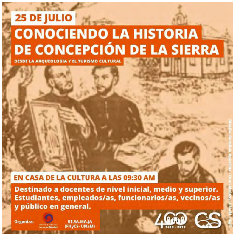
Figura 4. Invitación de charla “Conociendo la Historia de Concepción de la Sierra”. Miradas desde la Arqueología y el Turismo Cultural.

El taller realizado tuvo una respuesta positiva tanto en los niños y niñas que asistieron como en las docentes que ayudaron en todo momento en la organización. De esta manera, un determinado público accedió a cuestiones básicas sobre la arqueología por primera vez a partir del juego y la recreación del trabajo de un arqueólogo/a ( figura 5 ).