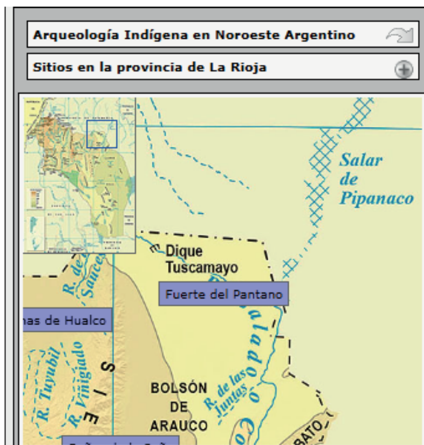
Imagen 1: Emplazamiento del Fuerte del Pantano (fundado en 1632 sobre territorio de comunidades originarias)