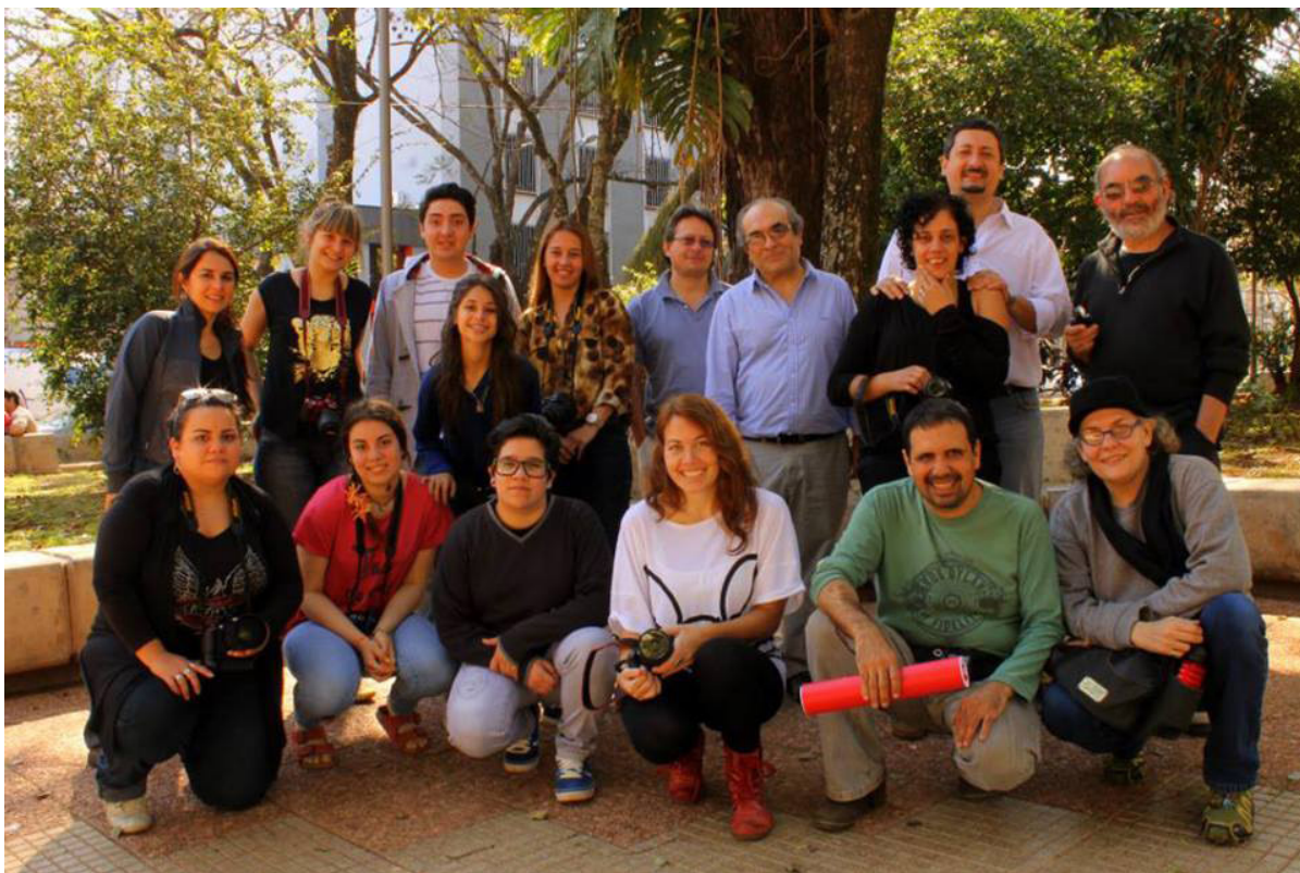
Taller de fotografía en Posadas

y Casinos: que no, que había dado pérdidas esos meses. Entonces nunca sabíamos si íbamos a cobrar el sueldo o no, hasta que después se incorporó al presupuesto provincial. Por eso, ya teniendo esa experiencia, de dónde van a salir los fondos y quiénes son los que van a producir. Por eso es bastante riesgoso decir qué puede pasar.