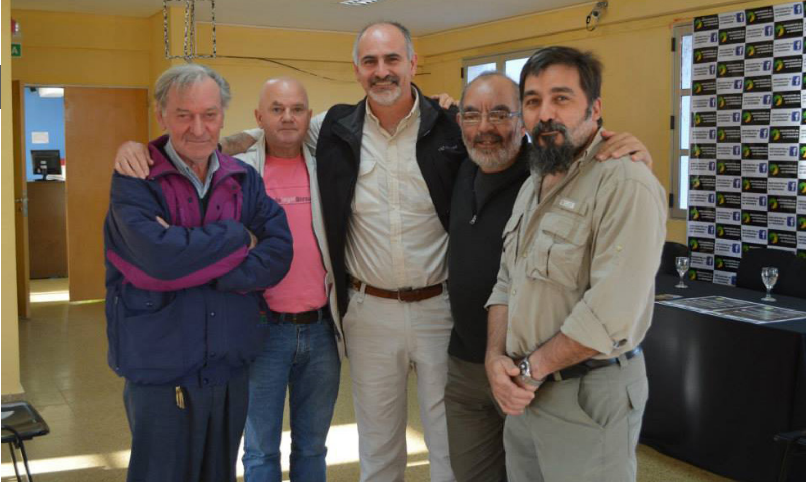
Lanzamiento del Primer Encuentro de Fotógrafos de Misiones