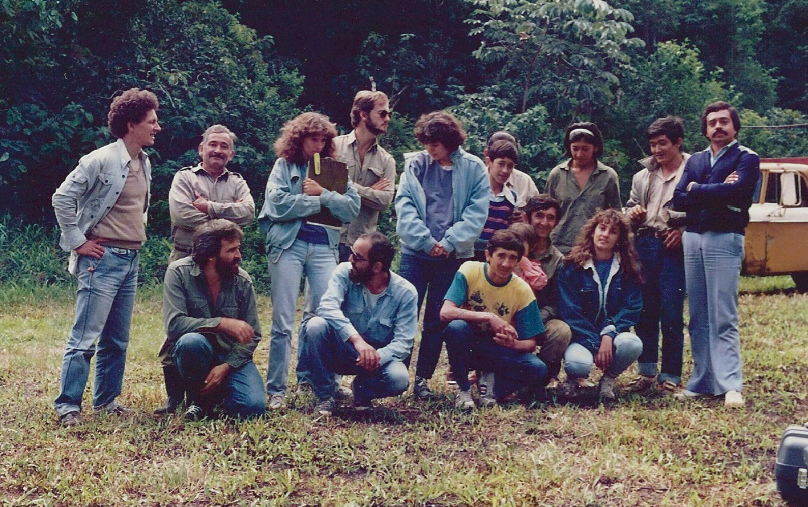
1987 - equipo produccion SIPTED (grabando Rapadureros del Cerro Sta Ana)